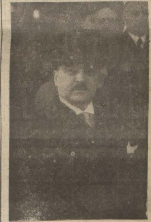
Yugoslavya Başvekilini Sirkeci Garında

« İlk defa Türkiye Cumhuriyeti toprağına ayak bastığım bu anda dost ve müttefik Türkiye'yi, onun uzun za- (Devamı 3 üncü sayfada)