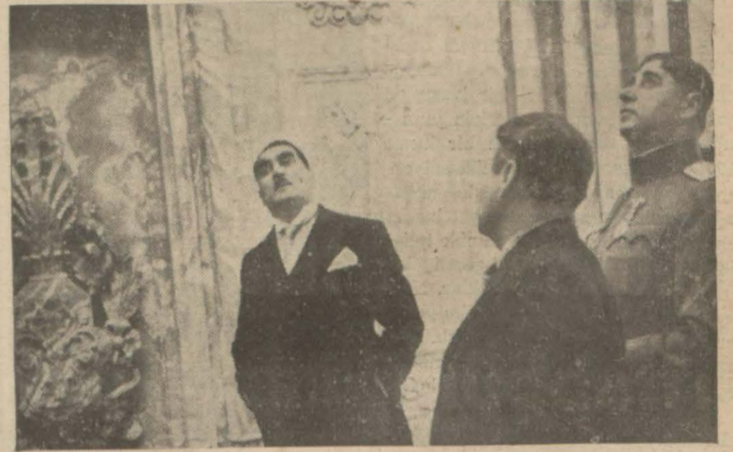
Muhterem Misafirimiz Sarayı gezerken

"Avrupanın bu karışık zamanında sulh için en faal şekilde Balkanlarda çalışılıyor. Seyahatim bunun delilidir,, Doktor Milan Stoyadinoviç dün şehri gezdi, İstanbul gazetecilerini kabul etti ve akşam Ankaraya gitti